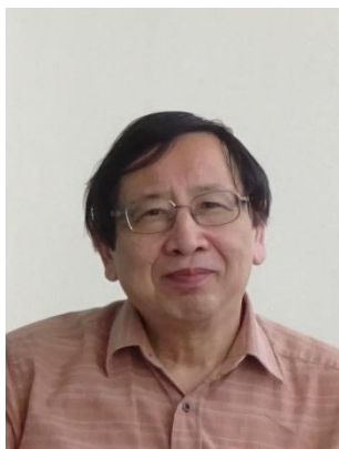
(一財) 地域創造 プロデューサー