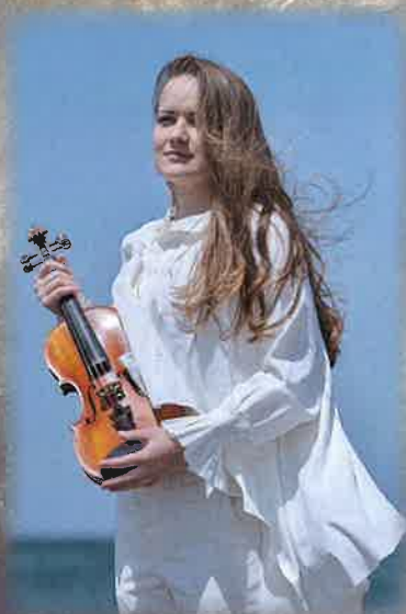
ヴァイオリン ジドレ

桐朋学園大学音楽学部演奏学科ピアノ科卒業。在学中、ロンドンでの演奏会出演をはじめ、桐朋学園オーケストラ & 桐朋オーケストラアカデミー合同演奏会でチェリストとピアノを担当。2005年北陸新人登竜門ピアノ部門優秀者のソリストとして、2019年いしかわ・金沢風と緑の楽都音楽祭「秋の陣」ソロピアニストとしてオーケストラ・アンサンブル金沢と共演。2010年福岡国際音楽祭「ジョイント・リサイタル賞」を受賞。2011年同音楽祭に出演。2013年リヒテンベルクにてA.ヴァルトマ教授マスタークラス・ファイナル・コンサートに出演。2014年ハンブルクにてアルベルト・シュヴァイツァー室内合唱団ピアニストを務め好評を博す。オペラピアニストとして「トスカ」「泣いた赤おに」等に携る他、ソロや室内楽で活躍中。