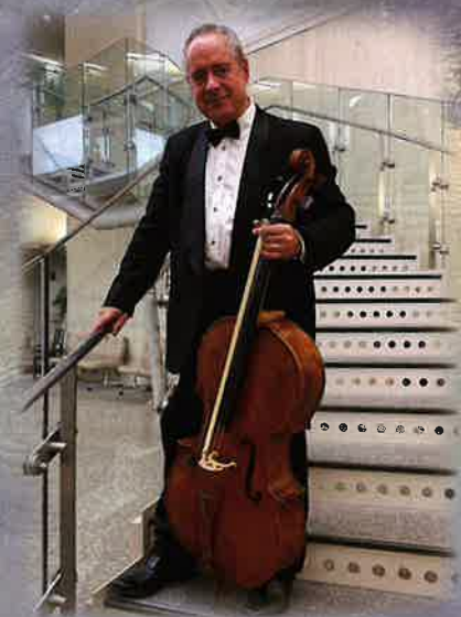
チェロ ルドヴィート・カンタ

音楽家一家に生まれ、幼い頃よりバイオリンを始める。2011年に国立MK チェルリョーニス美術学校を卒業し、2015年リトアニア音楽 & 劇芸術大学に於いて劇芸術学士、2017年には同大学でソロバイオリニストの修士課程を修了。2013年リトアニア室内楽コンクール優勝/2019年 第7回あおによし音楽コンクール奈良プロフェッショナルステージ グランプリ /2019年 センリア国際音楽コンクール優勝 /2019年 第20回大阪国際音楽コンクール弦楽器部門 第2位。2016年からオーケストラアンサンブル金沢の客員奏者になり、現在はフリーのバイオリン奏者として活躍中。2021-2022年シーズンの金沢市民芸術村のアーティスト・イン・レジデンスとして活動。